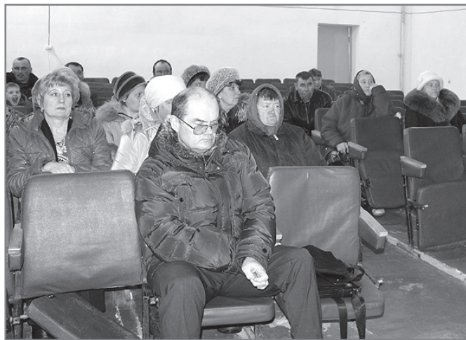
На встречу с гостями из райцентра пришли и дети, и люди старшего поколения.

После обсуждения проблем, получив ответы на интересующие вопросы, сельчане с большим удовольствием посмотрели концерт художественной самодеятельности Березовского СДК, встречая каждый номер дружными аплодисментами.