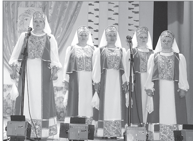
С концертом перед новощербаковцами выступили участники художественной самодеятельности Березовского СДК.